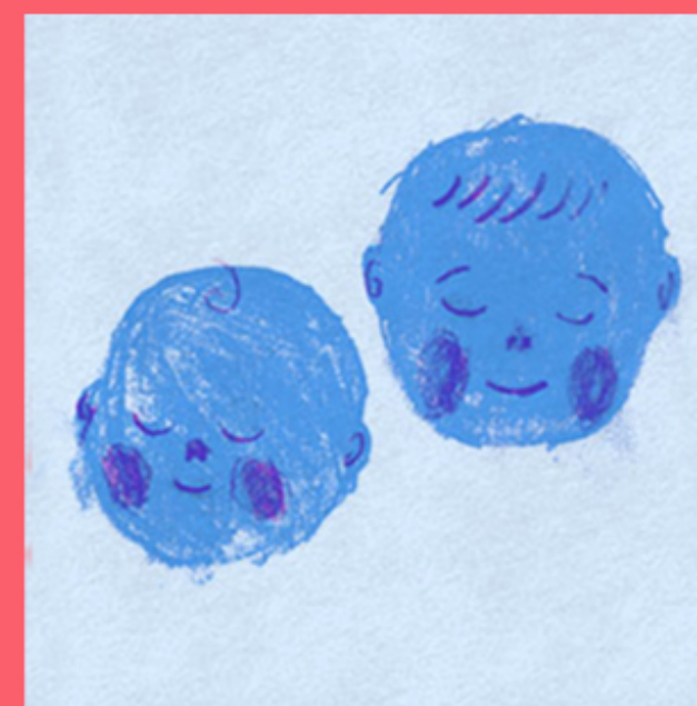
7 EXPERIÊNCIAS FUNDAMENTAIS DA INFÂNCIA