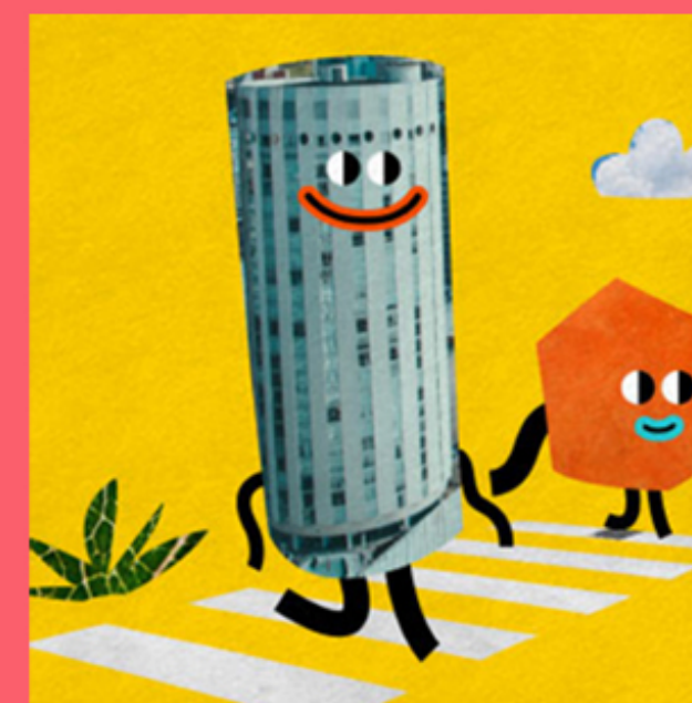
TERRITÓRIOS DE EXPLORAÇÕES