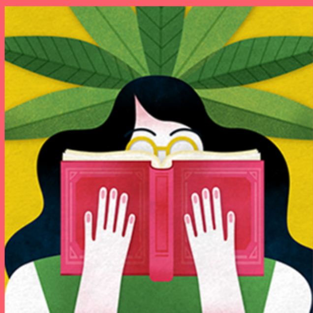
ESPAÇO DE LEITURA