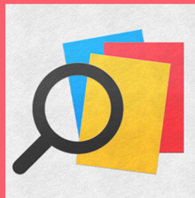
APRENDER A ESTUDAR TEXTOS